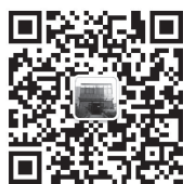
扫码关注微信公众号

国家战略扎堆河南，每一个都是以郑州为核心，引领性战略、专题性战略和总体性战略非常多，郑州如果不发展，就对不起国家出台的这些战略。