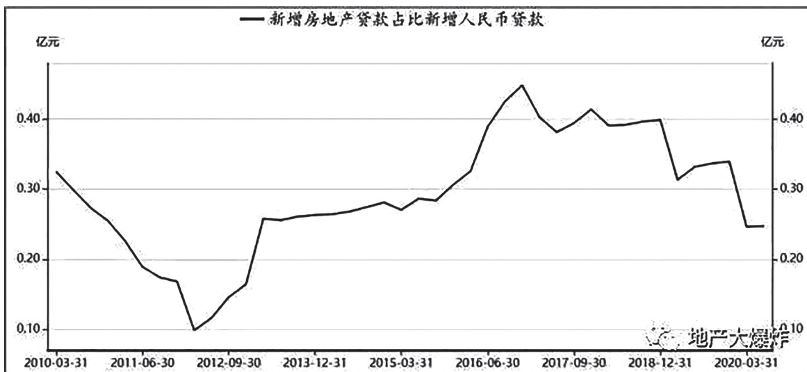
图1 新增房地产贷款占新增人民币贷款百分比

党的十八大后，政府层面对以往的房地产调控政策进行了反思，越调越贵的乱象饱受社会的诟病，房地产在2014年和2015年受到政策冷落，这两年时间，房地产市场在缓慢进行调整，各地库存高企。但到2016年年初，中央政府又出台了一系列的刺激政策，降低契税税率、降低首付和扩大公积金适用范围等一系列组合拳的推出，以往人们火热的购房热情又得到激发；不过到了9月份风向陡转，一系列调控政策又被祭出。2016年至今，房地产调控政策没有实质性放松。房地产作为资金密集型行业，高负债发展是其实现高速增长的重要手段，但是房地产新增贷款规模一直被压制。2019年7月，中央政治局会议首次提出“不将房地产作为短期刺激经济的手段”，从7月份开始全面收紧ABS供应链、海外信用债、开发贷。2019年，房地产开发贷三季度净增加1600亿，相比上半年的5600亿，环比增速明显降低；房企信用债7—11月份净融资为-305.2亿元，10—11月份ABS净融资连续为负值。即使2020年上半年受疫情影响较大，房地产开发贷款只增加了2.99万亿元，占上半年新增人民币贷款12.09万亿元的24.73%，较去年同比上升-6.85%。